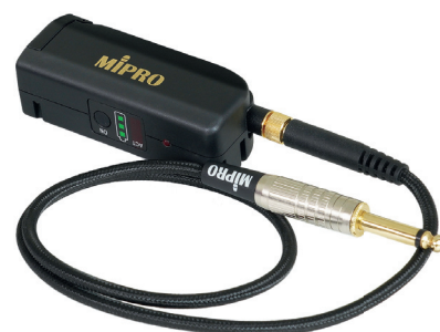
MT-58 mit Instrumentenkabel MJ-10E